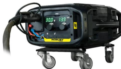
Kolečková sada funguje s podavačem horizontálně i vertikálně

Navštivte stránky esab.com , kde najdete další informace.