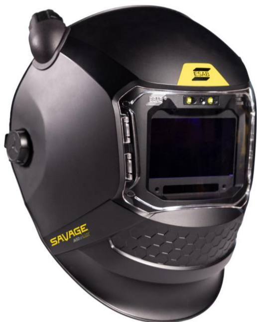
SAVAGE A50 Air LUX